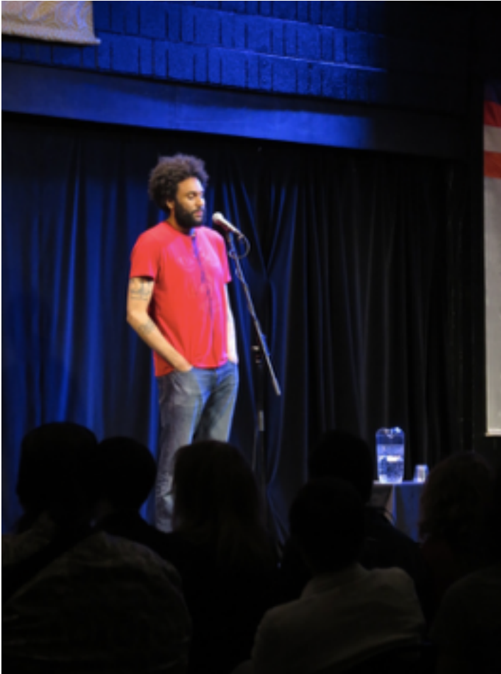
Tongo Eisen-Martin.

Cada semana del SWP se enfoca en un tema específico, y los poetas que son invitados a dar talleres tienen prácticas ligadas o relacionadas con esos temas. Todas las mañanas (salvo los miércoles, reservados a entrevistas personales entre estudiantes y maestros), los alumnos que se inscribieron en algún taller se encierran con el o la maestra poeta y aprenden, respiran, escriben, leen, a veces gritan o crean objetos, según lo haya planeado el o la tallerista. Los viernes por la tarde se presentan los trabajos de la semana. Las otras tardes son para lecturas, paneles, conferencias y performance, donde se habla de esta angustia por lo que viene, y de la rabia de quienes sí se sientan a escribir poemas en sus escritorios con incienso y parafernalia hippie, pero también estuvieron y están en la calle cuando se llama a denunciar, a resistir, a subvertir un orden que