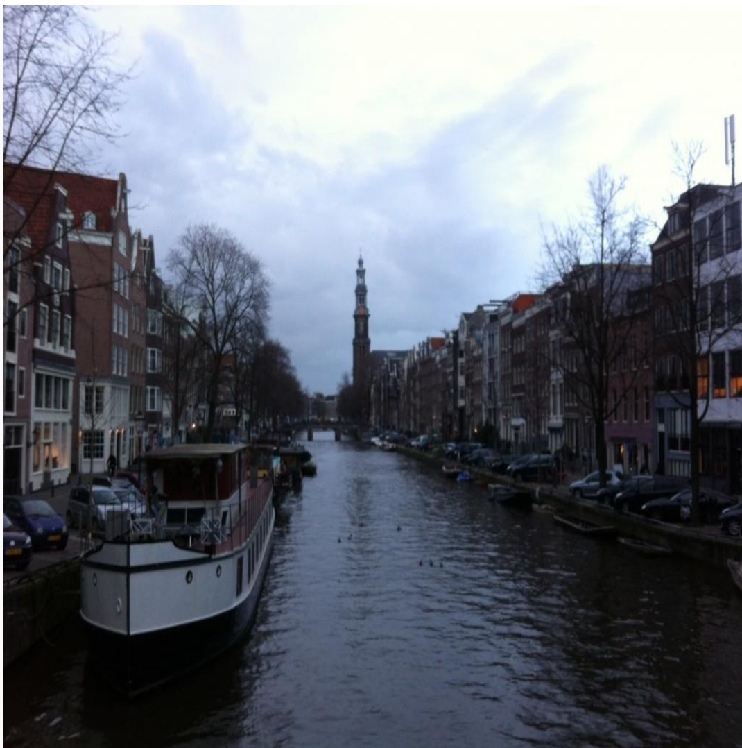
Ámsterdam, junio de 2014

Uno de mis objetivos era visitar galerías relativamente escondidas y espacios de producción creativa y teórica donde no solamente este autor había expuesto o del que se había archivado material, sino también donde se produce actualmente obra interdisciplinaria, con énfasis en prácticas audiovisuales contemporáneas y acercamientos a temas como el postdigitalismo, una perspectiva que, dentro o fuera