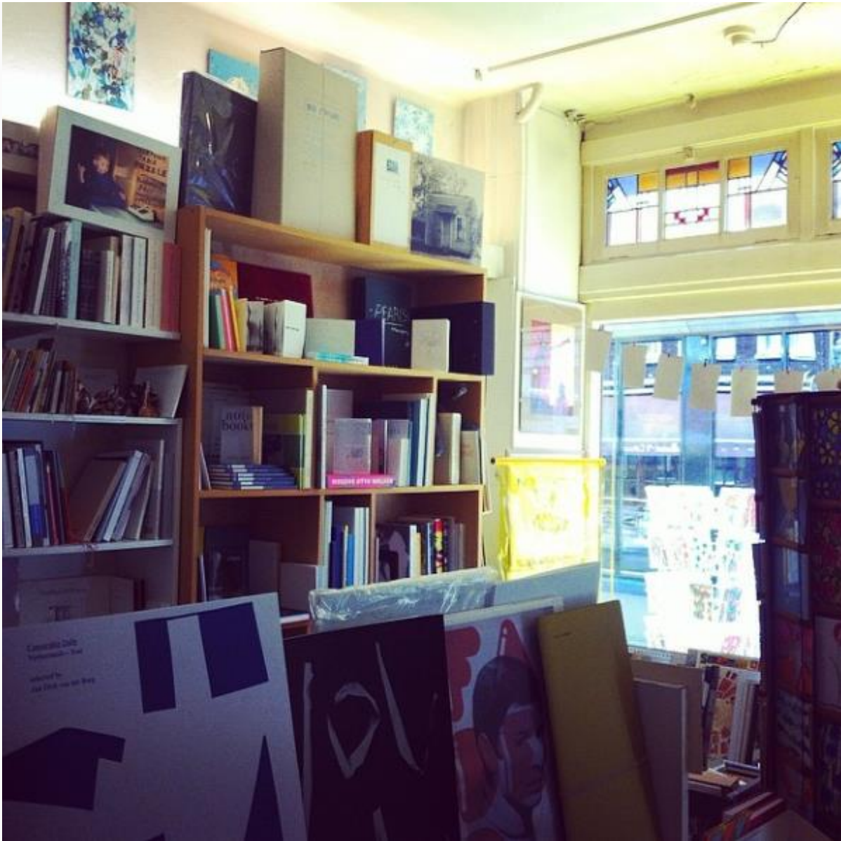
Librería Bookie Wookiee. Books by Artists, Berenstraat no. 16.

Me interesó al respecto, por ejemplo, saber que buena parte de la producción del net.art al que había seguido también la pista meses atrás ocurría allí, en una ciudad que pareciera querer mostrar tanto visualmente como en sus prácticas cotidianas una búsqueda por mantener cierta convivencia entre la tradición y la