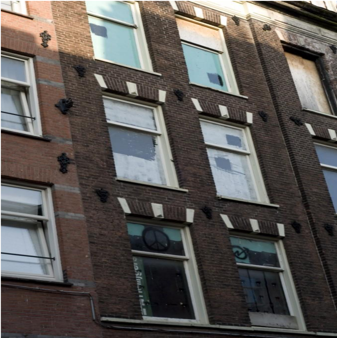
Ten Katestraat no. 53 en 2014.